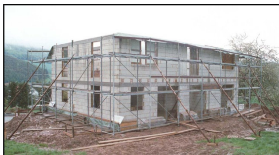
Der beheizte Teil des Hauses in der Rohbauphase: Ein viereckiger Kasten ohne jegliche Schnörkel

Das Haus sollte einerseits die hohen energiesparende Anforderungen möglichst optimal erfüllen, sich aber auch einer, dem regionalen Kulturraum angepassten Gebäudeform nicht zu weit entfernen. Das Gebäude wurde in Ost-West-Richtung gebaut. Dies ermöglicht einerseits größere Südfensterflächen für die passive, sowie große Süddachflächen für die aktive Nutzung der Sonnenenergie. Der beheizte Teil des Gebäudes besteht aus vier geraden Wandseiten ohne Nischen, Gauben, Erker, Vorsprünge, Dachschrägen oder ähnlichem. Solche „Kühlrippen“ hätten zu einer Oberflächenvergrößerung und damit zu verstärkten Wärmeverlusten des Gebäudes geführt. Komplizierte, teure und fehleranfällige Baudetails wurden somit ebenfalls vermieden. Hierdurch konnte ein sehr gutes Außenflächen-Wohnraum-Volumen-Verhältnis erreicht werden, sprich, eine im Verhältnis zum Wohnraum geringe Gebäudeaußenfläche.