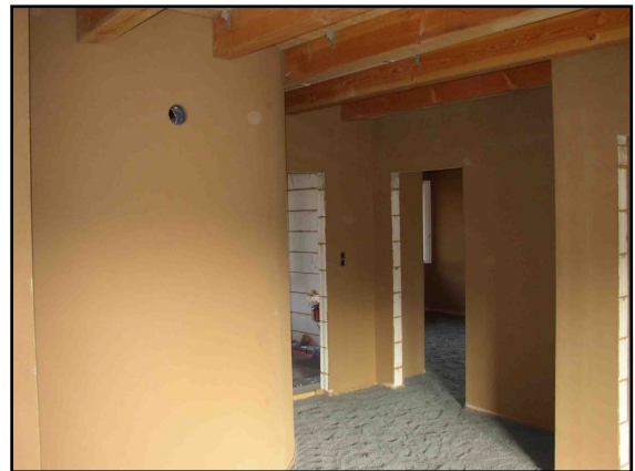
Lehmputz vor dem Anstrich

Holzfaserrplatten zur Wärmedämmung und Schallschutz. Die Putzträger für die Fachwerkausfüllung sind ebenso aus Holz, wie Türen, Fenster, Küche, ... Das Holz für den Dachstuhl stammt übrigens aus einem 500 m entfernt liegenden Waldstück. Um eine hohe Wärmespeicherfähigkeit im Gebäude zu erreichen, wurden die Wände mit Kalksandstein gemauert. Im Winterhalbjahr wird die tagsüber durch die Südfenster gewonnene Wärme gespeichert und nachts wieder an den Raum abgegeben. Eine weitere Besonderheit ist der Lehmputz. Lehm ist ein alter, fast vergessener Baustoff der in den letzten Jahren eine regelrechte Renaissance erlebt. Neben einem sehr geringen Energieaufwand bei der Aufbereitung, ist er ein idealer Wärmespeicher. Er hat eine ausgleichende Wirkung auf die Raumluftfeuchte und ist naturbelassen, also frei von jeglichen Zusätzen.