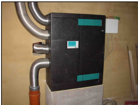
... bis zum Wärmerückgewinnungsgerät im Keller

Baustoffe: Holz, Kalksandstein, Lehm Die Verwendung von Holz als Baustoff spielte beim Bau dieses Hauses eine zentrale Rolle. Beim Außenfachwerk und Dachstuhl beginnend, über den Fußbodenaufbau mit Massivholzdielen, Holzdeckenbalken, Deckenaufbau und Deckenverkleidung, oder Zellulose und