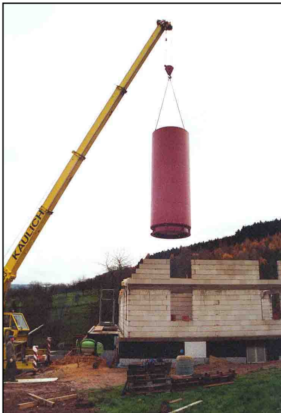
Der 5½m hohe Speicher wird während der Rohbauphase ins Haus gehoben...

Die große Kollektorfläche ist mit steiler 55° Neigung, optimal für die Strahlungsnutzung der tief stehenden Sonne im Winterhalbjahr nach Süden ausgerichtet. Sie erwärmt den 5½ m hohen Wasserspeicher im Inneren des Hauses. Der 12.300 Liter große Tank, in dessen oberen Teil ein Edelstahlboiler zur Brauchwassererwärmung integriert ist, steht mitten im Gebäude. Das Haus wurde sozusagen um den Wassertank gebaut. Dies hat den Vorteil, dass die trotz guter Dämmung immer noch vorhandene geringe Wärmeabstrahlung im Wohnraum verbleibt und nicht ungewollt den Keller beheizt.