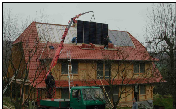
Das zweite von drei 15m 2 großen Kollektorfeldern wird aufs Dach gehoben

Auch die Anordnung der Zimmer wurde nicht zufällig gewählt. Räume, in denen man sich vermutlich länger aufhält, wie Wohnzimmer, Küche und Kinderzimmer liegen auf der Südseite, Badezimmer und reine Schlafräume im Norden. Die Fensterfläche im Süden ist etwa doppelt so groß wie die im Norden. Durch einen unbeheizten Vorbau ist der an der Nordseite liegende Eingangsbereich nochmals vor Kälte geschützt. Er dient auch dazu, in den komplett unbeheizten Keller zu gelangen, ohne die Dämmhülle wegen einer Kellertreppe zusätzlich unterbrechen zu müssen. Aus gleichem Grund befindet sich auch keine Bodentreppe direkt im Haus. Den ebenfalls unbeheizten Dachboden erreicht man über eine kleine Außentreppe auf dem Balkon.