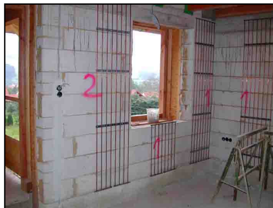
Die Wandheizregister in der Ferienwohnung vor dem Verputzen

Durch die Entscheidung für eine Wand- und gegen eine Fußbodenheizung konnten nun in fast allen Räumen Massivholzdielen verlegt werden, ein Wunsch des Bauherrn, der bei einer Fußbodenheizung nicht sinnvoll zu verwirklichen gewesen wäre. Etwas Vorsicht ist beim Aufhängen von Bildern und Wandregalen geboten. Mit Infrarotthermometer, Metallsuchgerät oder ganz einfach durch einen Verdunstungstest, mit einer gewöhnlichen Blumenspritze lassen sich die Kupferrohre aber gut orten.