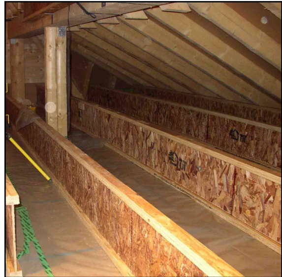
40 cm hohe Stegträger auf dem Dachboden schaffen Hohlraum für viel Dämmung

Auch die Fenster und Außentüren sind nicht von der „Stange“. Dreifachverglasung mit gedämmten Rahmen machen aus früheren „Kältelöchern“ regelrechte Sonnenfallen, die an klaren kalten Wintertagen mehr Wärme ins Haus lassen, wie sie wieder abgeben.