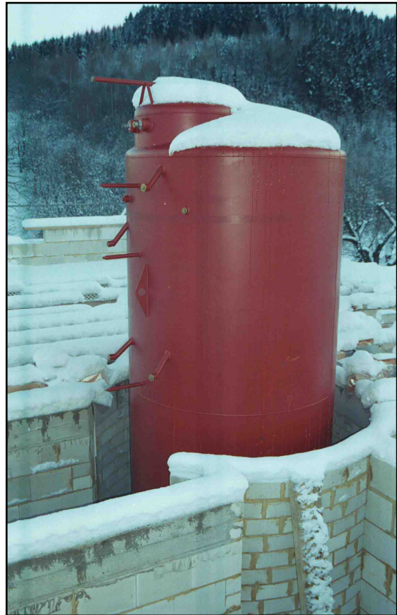
...und reicht über 2 Etagen Eingeschneiter Speicher im Winter

Gleiches gilt für alle Warmwasser- und Heizungsleitungen. Das Heizsystem und arbeitet somit praktisch verlustfrei. Einmal aufgeheizt können je nach Witterung problemlos einige Wochen überbrückt werden. Aber selbst an kalten, klaren Wintertagen mit Dauerfrost wird mehr Energie in der Anlage gespeichert, wie verbraucht. Damit die Sonne im Winterhalbjahr optimal genutzt wird, übernimmt eine frei programmierbare Steuerung das so genannte "Speicher-Management". Je nach erreichter Kollektortemperatur wird die Wärme in den unteren oder auch oberen Teil des Speichers eingeschichtet. Die Solarflüssigkeit fließt aber immer durch den unteren kälteren Teil des Speichers und nutzt so die Sonnenwärme optimal aus. Auch bei der Entnahme für die Heizung wird ein 5-Wegemischer so angesteuert, dass zuerst der untere Teil des Speichers genutzt wird. Somit bleibt eine für die optimale Funktion wichtige