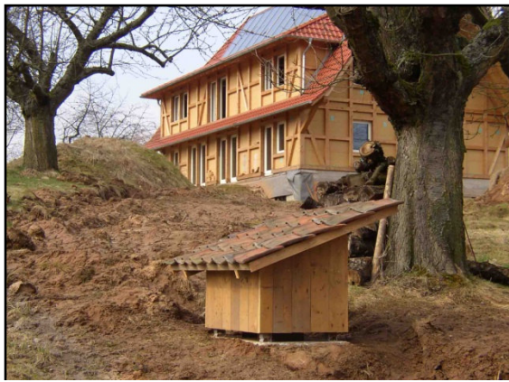
Von der Frischluftfilterbox im Garten geht es 45 m durch die Erde ...

durch unangenehmes Zugluftempfinden noch durch Geräusche wahrnehmbar. Im Sommerhalbjahr kann die Lüftung wahlweise wieder über die Fenster erfolgen, man kann das Erdregister aber auch zum Kühlen der Wohnung einsetzen. Bei der zu erwartenden Klimaerwärmung könnte das Haus zukünftig auch über die Lüftungsanlage mit Hilfe einer Klimaanlage gekühlt werden. Die Energieeffizienz während der Heizperiode ist selbst im Vergleich zu einer sehr guten Wärmepumpe unschlagbar. Der Stromverbrauch der Lüftung liegt bei 180 kWh/Jahr.